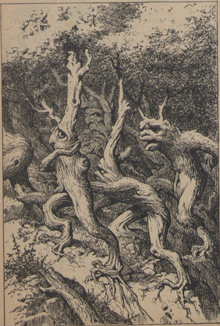
Els arbres fugint del home, destructor dels boscos.