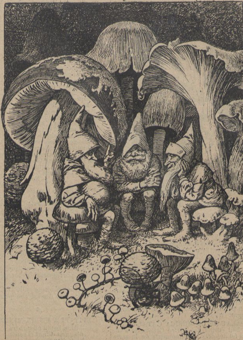
Flak, Nik y Puk, reunits en consell.