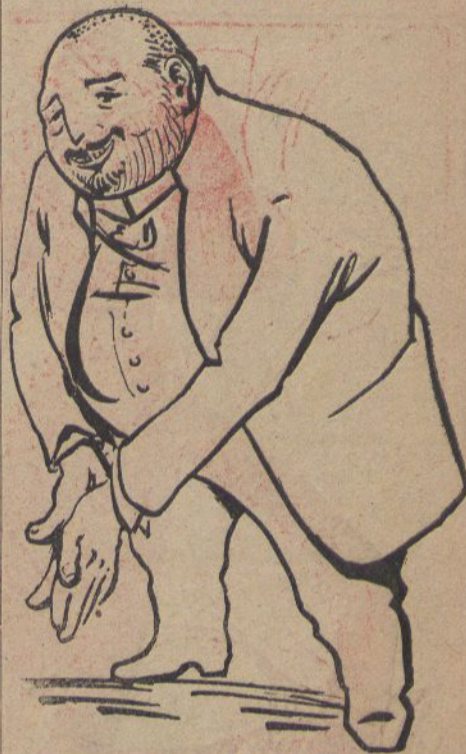
Buenas comilonas se nos preparan!...