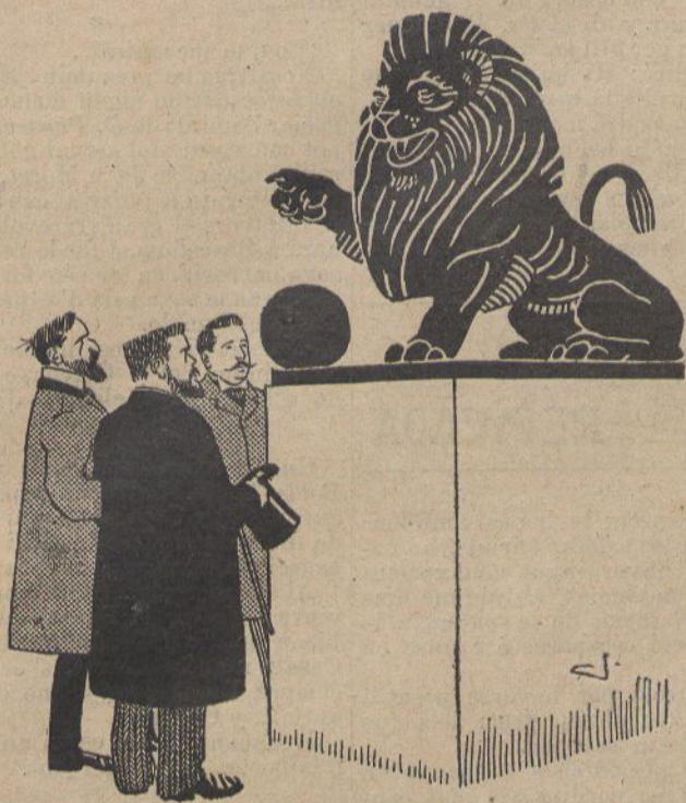
— Si continuan Vdes así, hasta yo me calo la barretina y aprendo á decir aquello de los «sese chuches». (Dib. de JUNCEDA)

El R. Decret de las porterías es senzillament despòtich, inquisitorial y ridícol, y será també del tot inútil mentres no s'hi afegeixi un articlet per l'istil: