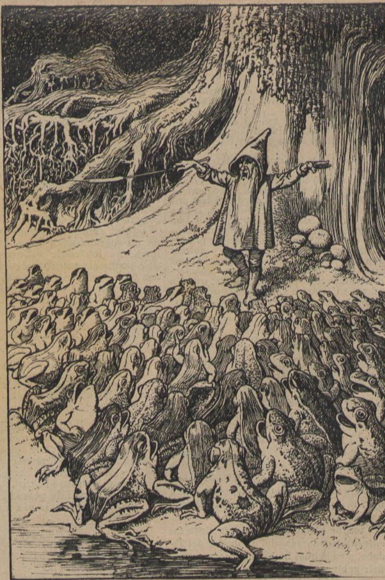
El Concert de las granotas.