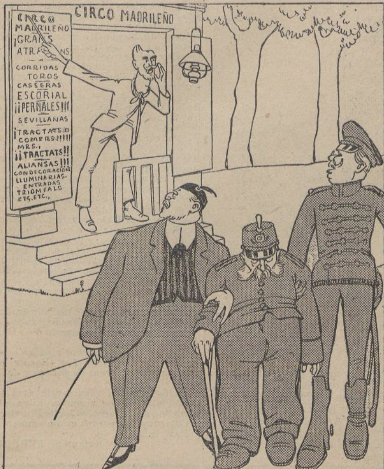
¡Prou se desganayita cridantlos que entrin! ¡Tots passen de llarch! (Dib. d'APA.)