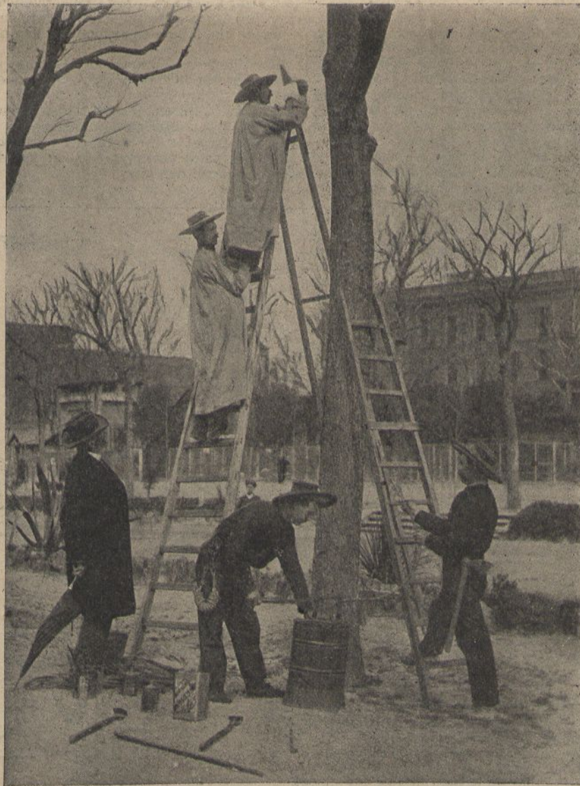
Brigada sanitaria dels arbres. (Vegis l'article.)