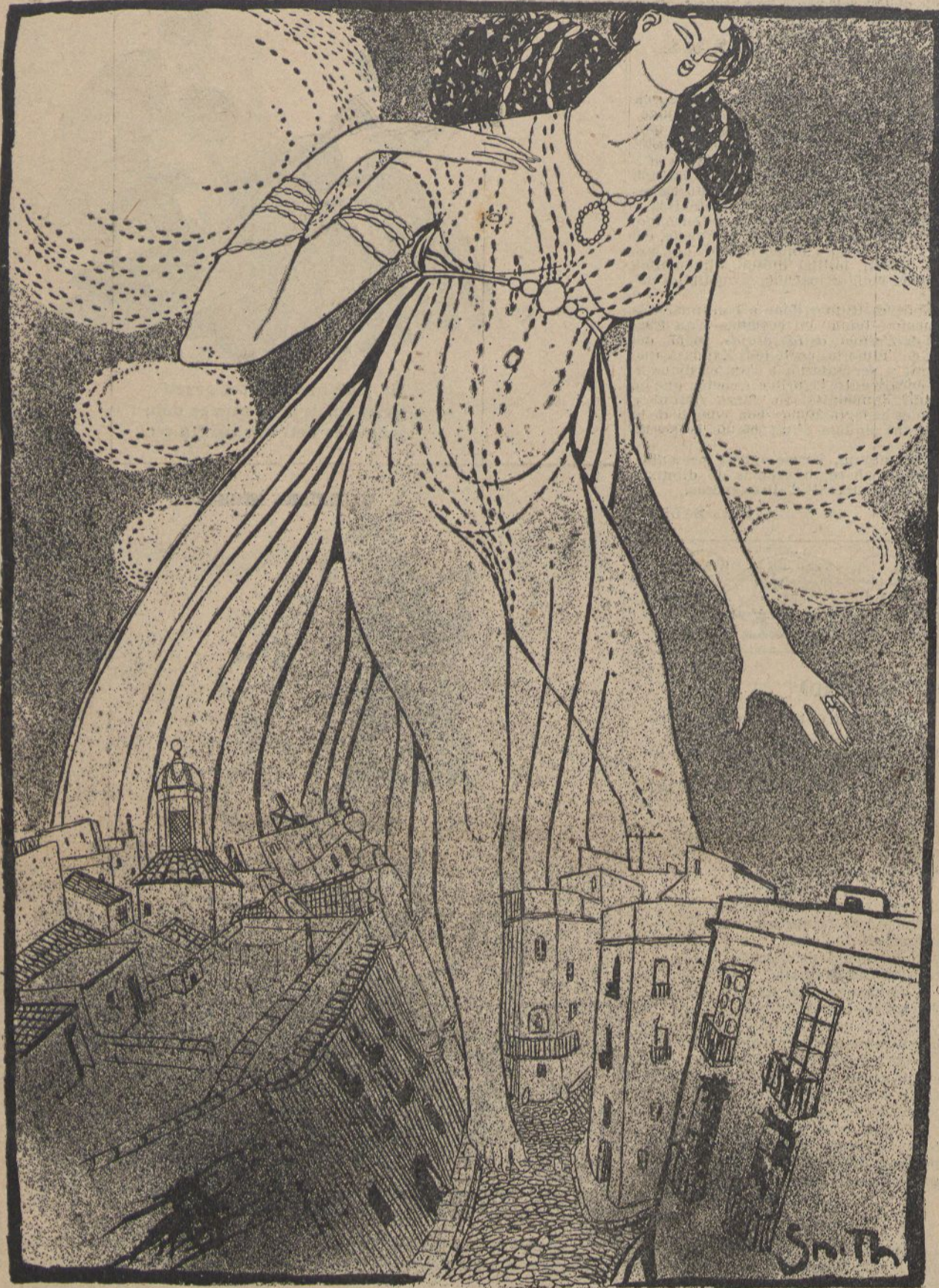
De primer las vías, pero després l'ánima de la Ciutat: sols aixís serà interior.