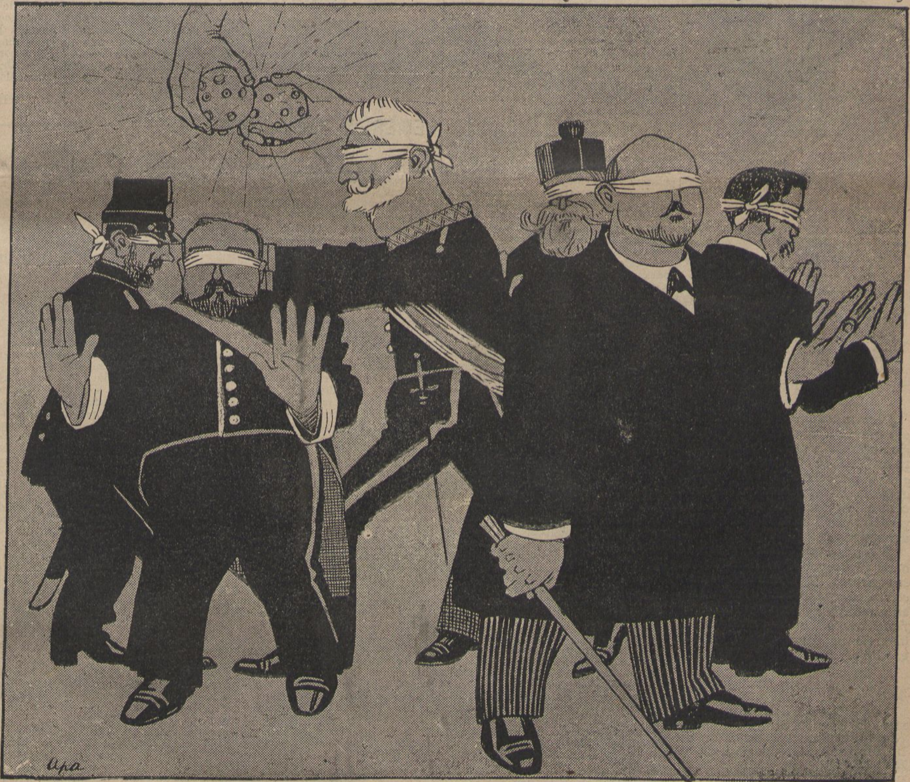
La gallina cega.