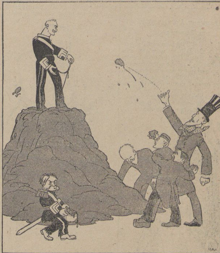
Els lliberals, a copia de tirarli llot, li han fet un pedestal. ... Però un pedestal de fanch. (Dib. d'APA.)

consideri Jurat en aquest procés. Als catorze ciutadans que ha designat la sort, s'hi suma la totalitat de la població sense distinció de sexes, edats ni classes socials. Això vol dir que may un Tribunal Popular s'ha vist tan fortament apoyat per l'opinió pública en el compliment de la seva honorosa i cívica comanda.