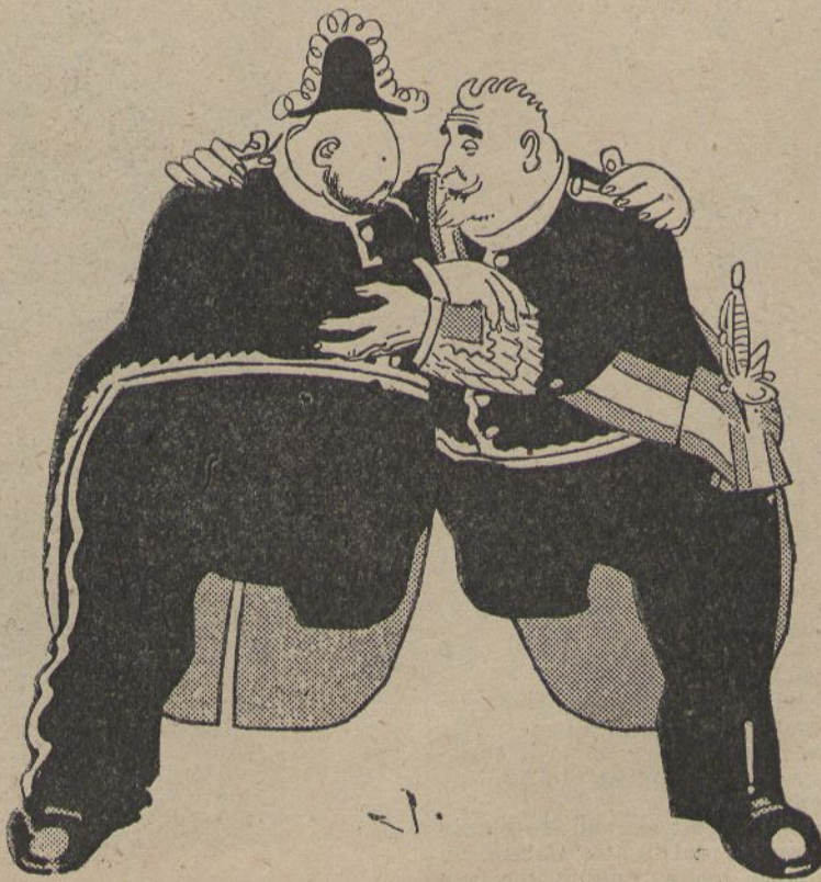
—Amiguet: agafemnos fort! Encara ens queda una cama pera aguantarnos. (Dib. de JUNCEDA.)

A partir del proxim número LA CAMPANA CATALANA sortirà cada dimecres