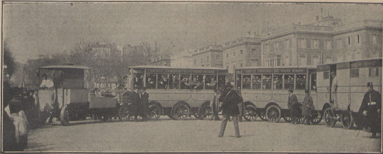
El tren Renard. (Vegis l'article.)