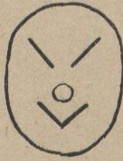
La lluna de mel va ser deliciosa.