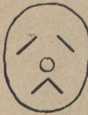
Un dia va ennu- volarse la meva fe- licitat.