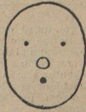
Peró vaig pensar: ¡Bah!... Las resolu- cions extremas sempre són funes- tas!