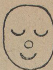
...y vaig casarme.