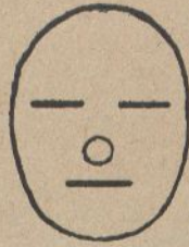
Jo vivia en pau fins que...