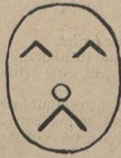
Las quinas ¡ay! vaig veure confri- madas.