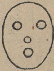
Vaig maquinat una venjansa exem- plar!!!