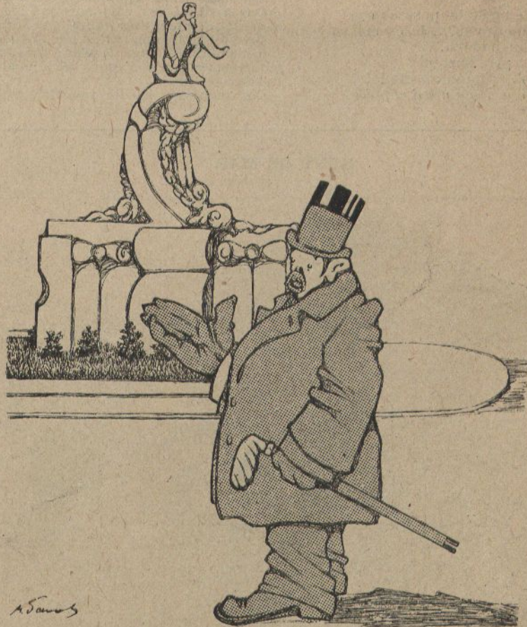
—Ja no més me falta aquét y el de Colon pera haverne seguit set com mana la santa mare Iglesia.