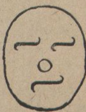
Vaig concebir sos- pitas graves.