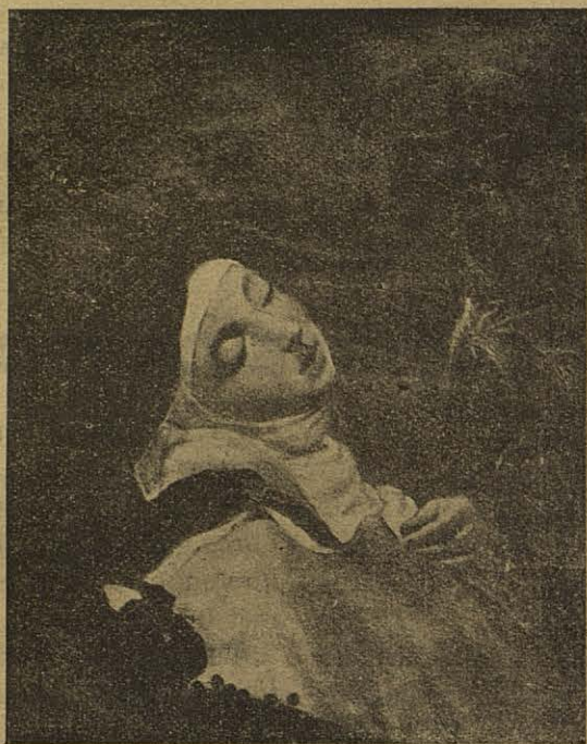
Extasis de Sta. Teresa.