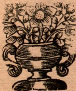
Ateneu A. G. — Enric Granados, 22, Barcelona.