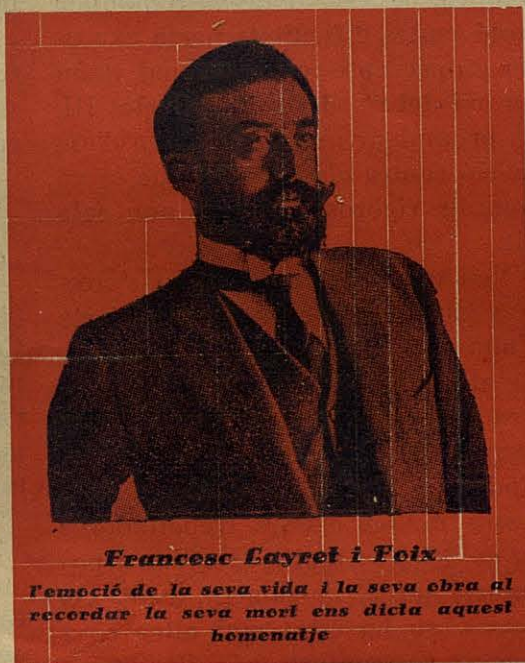
Francesc Layret i Foix L'emoció de la seva vida i la seva obra al recordar la seva mort ens dicta aquest homenatge

Aquestes Comissions, en col·laborar amb els Consellers en els projectes que els hi siguin sotmesos, permetran intensificar l'eficàcia i el volum de la seva