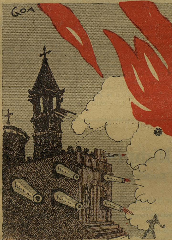
El que no hauria de passar l'any 1909 ni l'any 1932