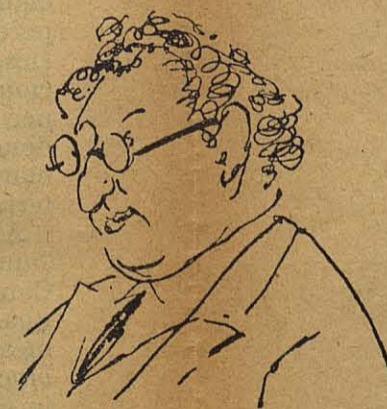
E. Orlega i Gasset

Totes aquestes temptatives, encara que fallides, ajudaren a fer comprendre a tothom la necessitat d'un Congrés on s'establissin un ideari i un programa mínim en el que coincidissim tots.