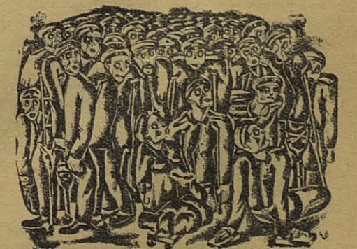
Els badoes davant les lluminàries que pagarem 34 anys seguits

--Què son aquestes olles? --Les veres efígies dels regidors de R. C. després de la pròrroga del contracte de la neteja.