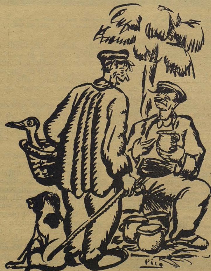
Del temps Berenguer