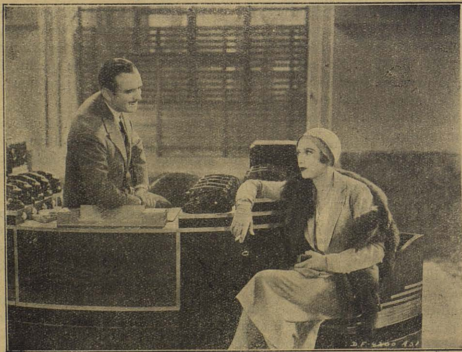
Douglas Fairbanks i Bebe Daniels en el film «Para alcanzar la luna»

dor, força estimables i d'interpretació ben sincera.