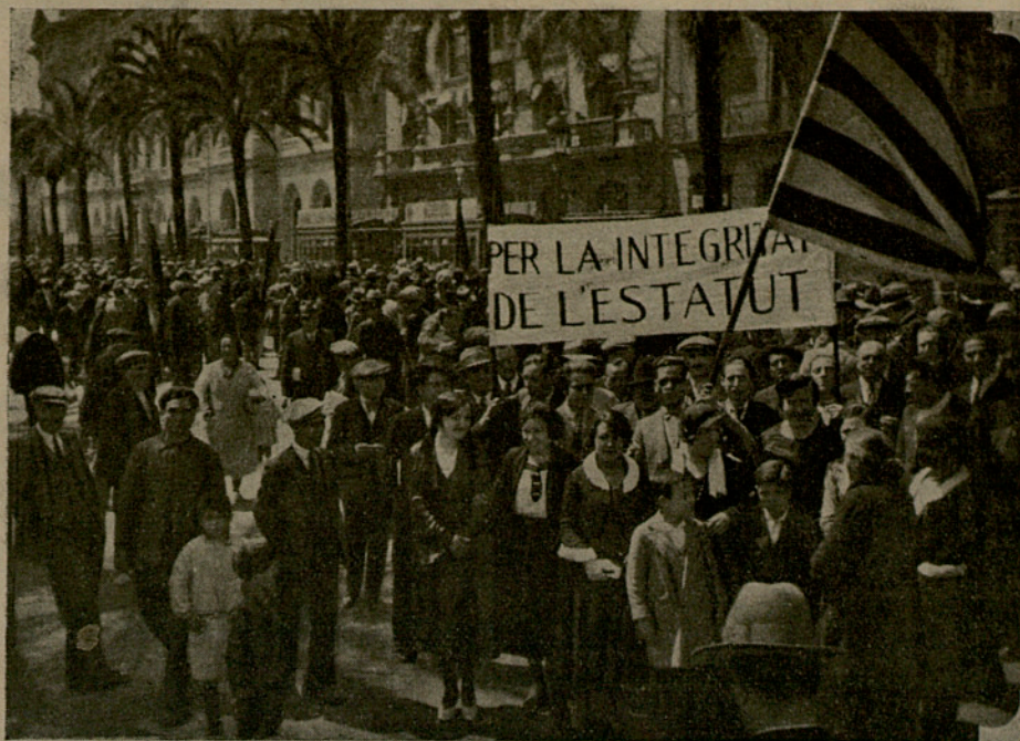
la bandera de l'ateneu nacionalista republicà de la bonanova i la pancarta del nostre casal, a la manifestació pro-integritat de l'estatut clixé agosti