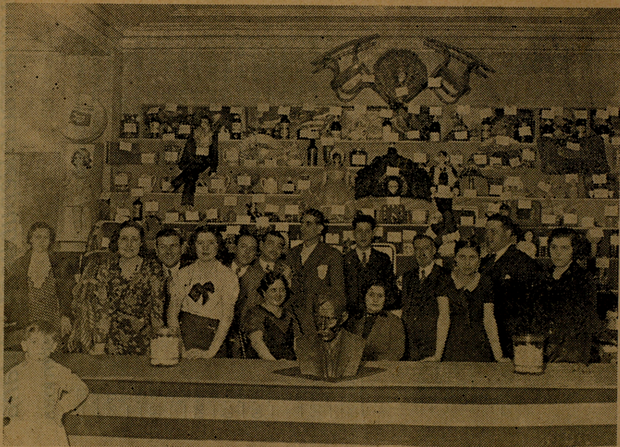
TOMBOLA OBERTA EN EL NOSTRE CENTRE DURANT LES FESTES DEL II ANIVERSARI DE LA PROCLAMACIO DE LA REPUBLICA CATALANA