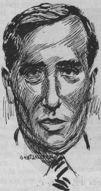
En Miquel Santaló

Conseller primer del Govern de la Generalitat