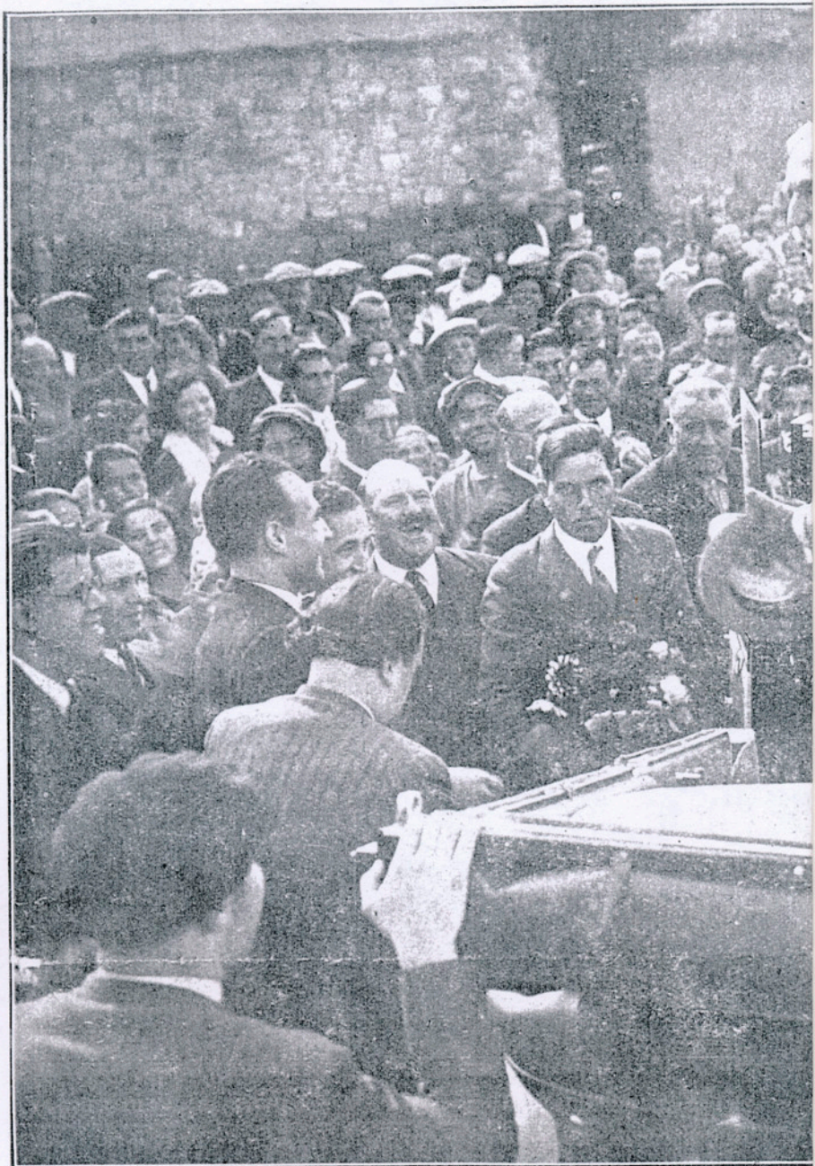
ACÍ TENIU NOSTRE «AVI», EL GRAN PATRICI, EL QUE FOU PRIMER REPUBLICANA SALUDANT AL POBLE DE BELLPUIG EN LA SE