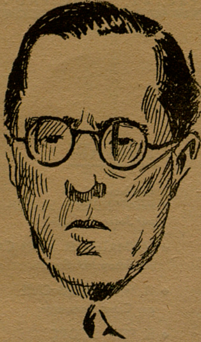
JOSEP A. TRABAL

Diputat al Parlament de la República Espanyola per Barcelona-circumscripció, president honorari de l'Ateneu Republicà Català