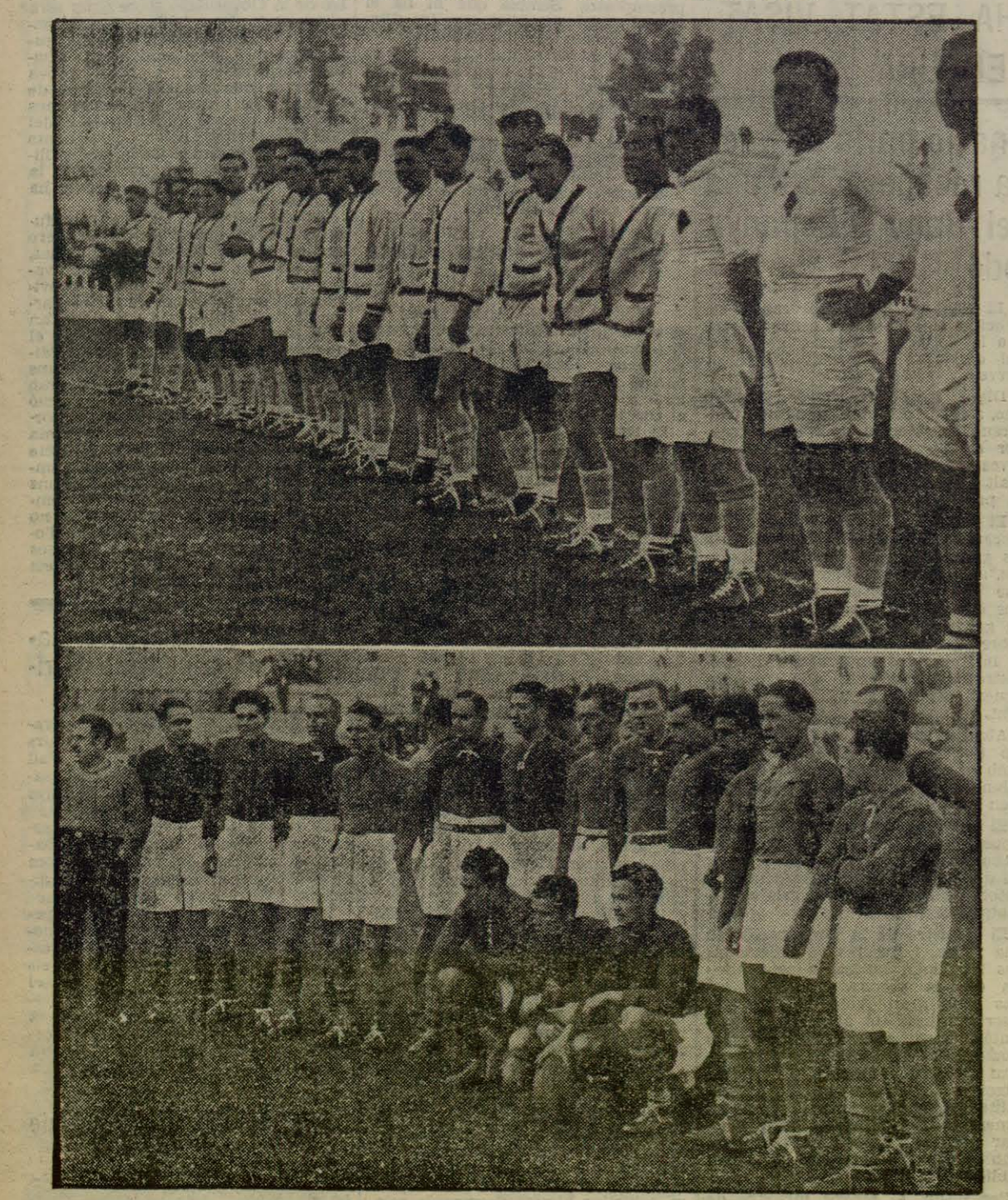
A dalt: l'equip dels «Arlequins», de Perpinyà, que disputaren un encontre, venent-lo, al del «Barcelona». A baix, els jugadors catalans