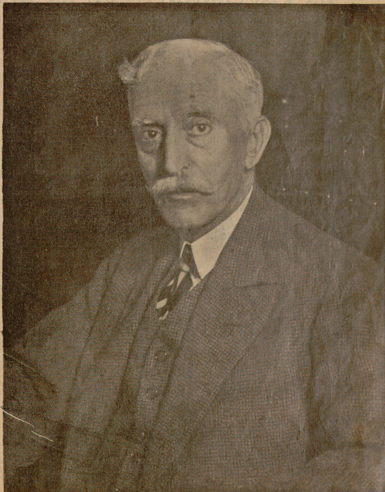
FRANCESC MACIÀ, L'HEROI DEL 14 D'ABRIL