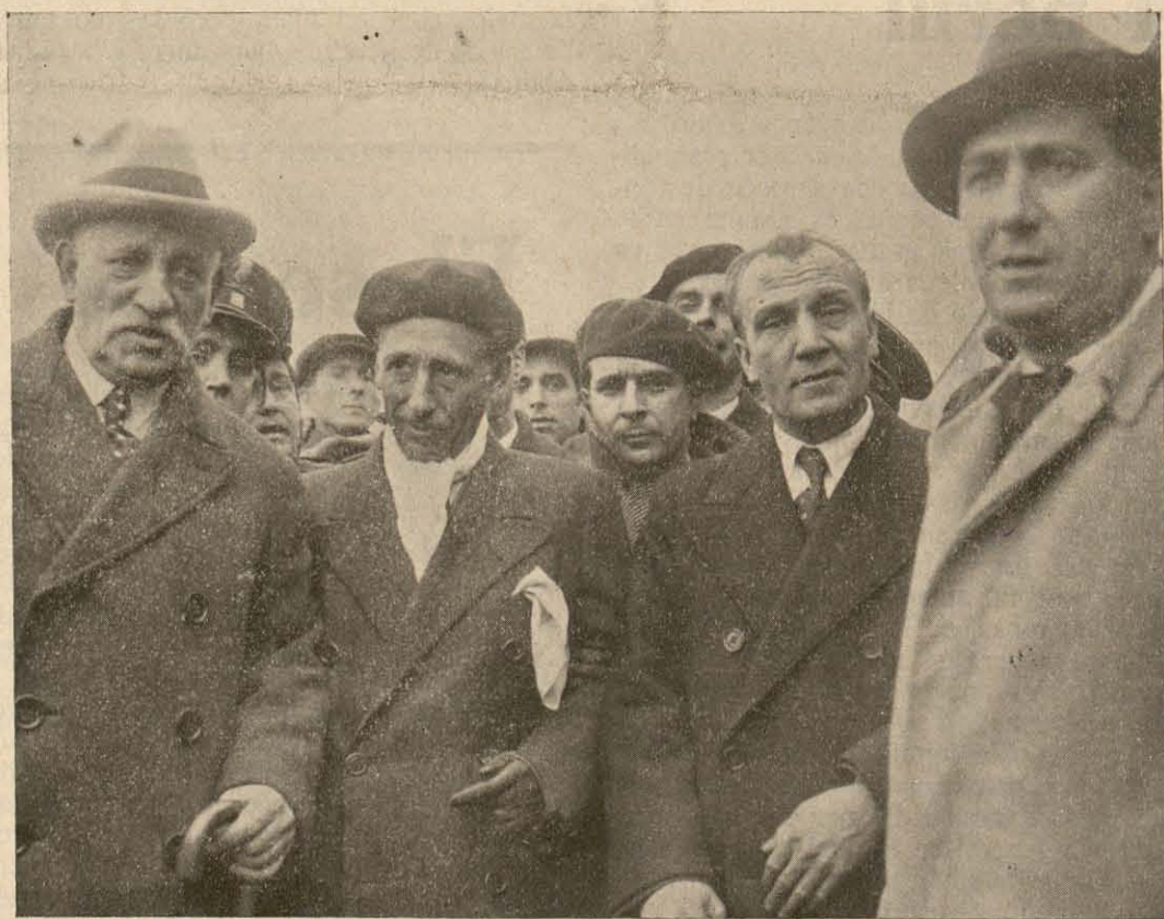
Companys després de baixar del tren a Castelldefels.

Visca la Confederació de Repúbliques Ibèriques!