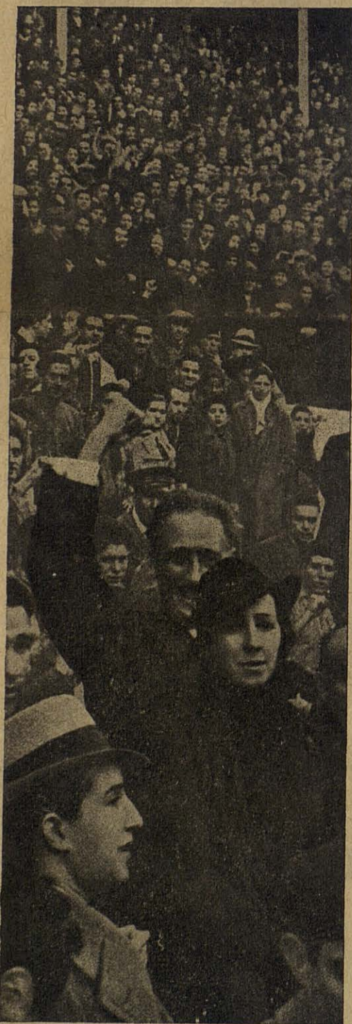
EL PUNY ENLAIRE...!

Per un motiu i per l'altre, les Joventuts d'esquerra "Estat Català", saluden, coincidint amb el gest de Lluís Companys, com ell, a tota la massa proletària, amb el puny clos i enlaire!