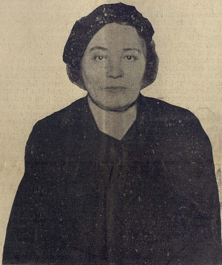
La Mare dels Màrtirs

La plaça de la Fe, és plena. Nosaltres fu- gim dels grups de representacions, on les o- pinions surten una mica mineralitzades a desgrat del moment apassionat i ens fem entre la gent. Hi ha una tònica de sentiment