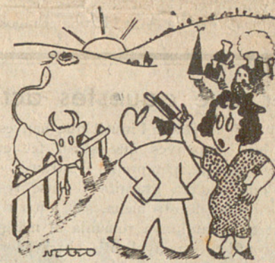
— No està mal aquesta posta de sol!... — Sobretot per un país petit!...

Totes les dictadures, en actuar contra les majories, cauen en el despotisme.