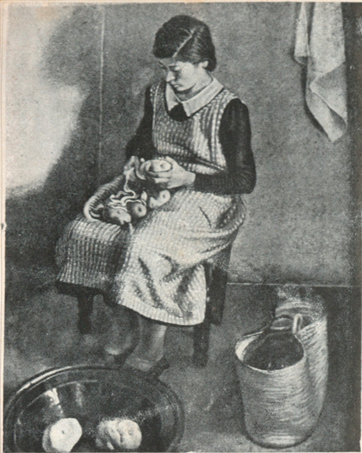
“L'ANGELETA” - Feliu Elias

—Què opinen d'una escola essencialment catalana?