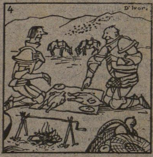
...DE L'EDAT MITJANA