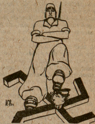
El que no han sabut o volgut fer els governs, hauran de fer-ho els pobles seguint el nostre exemple