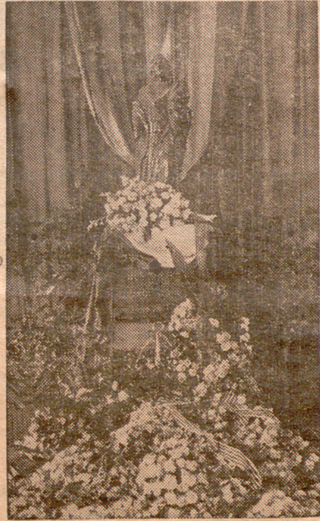
L'Estàtua de Rafel Casanova, coberta de flors

Las tropas al servicio de Felipe V, primer Rey de dinastía borbónica, entraron victoriosas en Barcelona, sede del