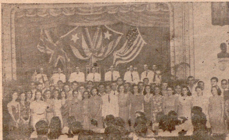
Presidència de l'Acte. Al peu, els orfeonistes en acabar de cantar

ción de sus recursos económicos, ni las prohibiciones de su idioma, ni todos cuantos obstáculos se han opuesto a la ordenación de sus instituciones culturales; ni las persecuciones, ni las cárceles, ni las ejecuciones y los asesinatos; ni la más cruel tiranía y la opresión más irritante, han podido, jamás, privar el camino ascendente de nuestra nacionalidad hacia su total liberación.