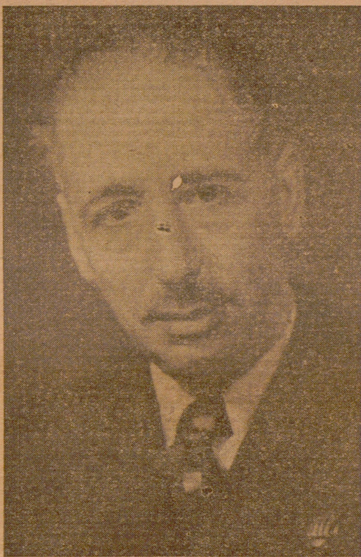
EL PRESIDENT LLUIS COMPANYS

L'assassinat de Francesc Layret, la preso, el Diputat i la seva manilla riallera, tot es barreja dins del meu cervell. Més tard 1931; campanya electoral, gran acte public de l'avantveilla de les eleccions, Lluís Companys parla i ens recordem d'aquests mots que frapàren el nostre raonament de jove de 17 anys. S'adreçava a la Lliga Regionalista i els deia: « Nosaltres no us regategem ni la vostra intel·ligència ni la vostra capacitat per a governar, pero us manca « l'emoçió patriòtica del moment polític que vivim. » I aquests mots han tingut una gran influència sobre la nostra formació política, ells ens descobriren les dretes retrogrades i egoistes sota el seu veritable angle. (Segueix pag. 2).