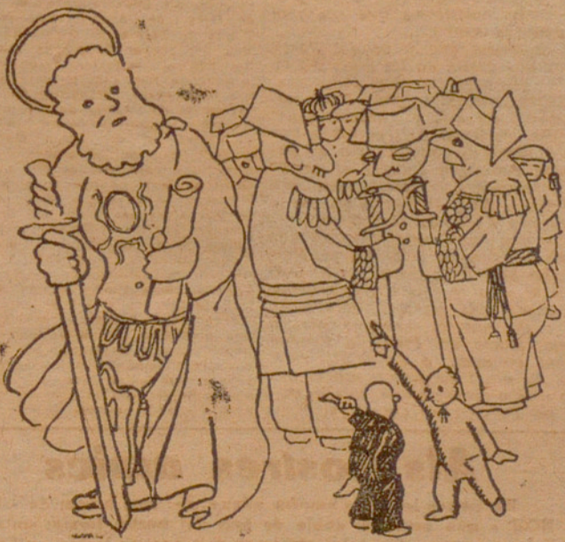
CAMINS DE DAMASC