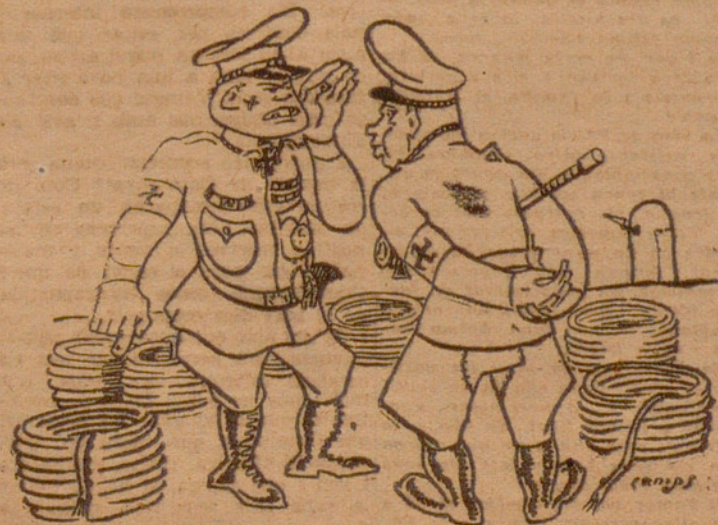
— JA HO VEUS, HIMMLER AL PODER, LA GUESTAPO ENS FARA LA GUERRA I — CALLA, CALLA, QUE JA FA PROU TEMPS QUE ENS LA FA