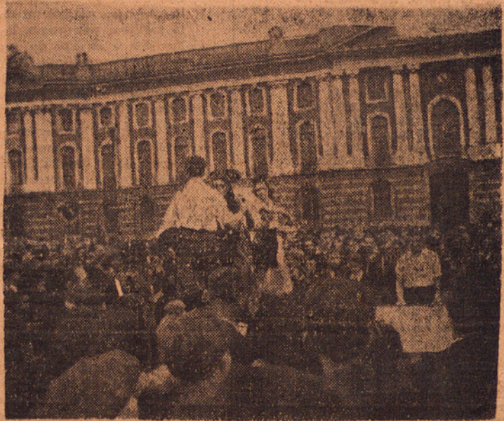
Ballets catalans, place du Capitole.