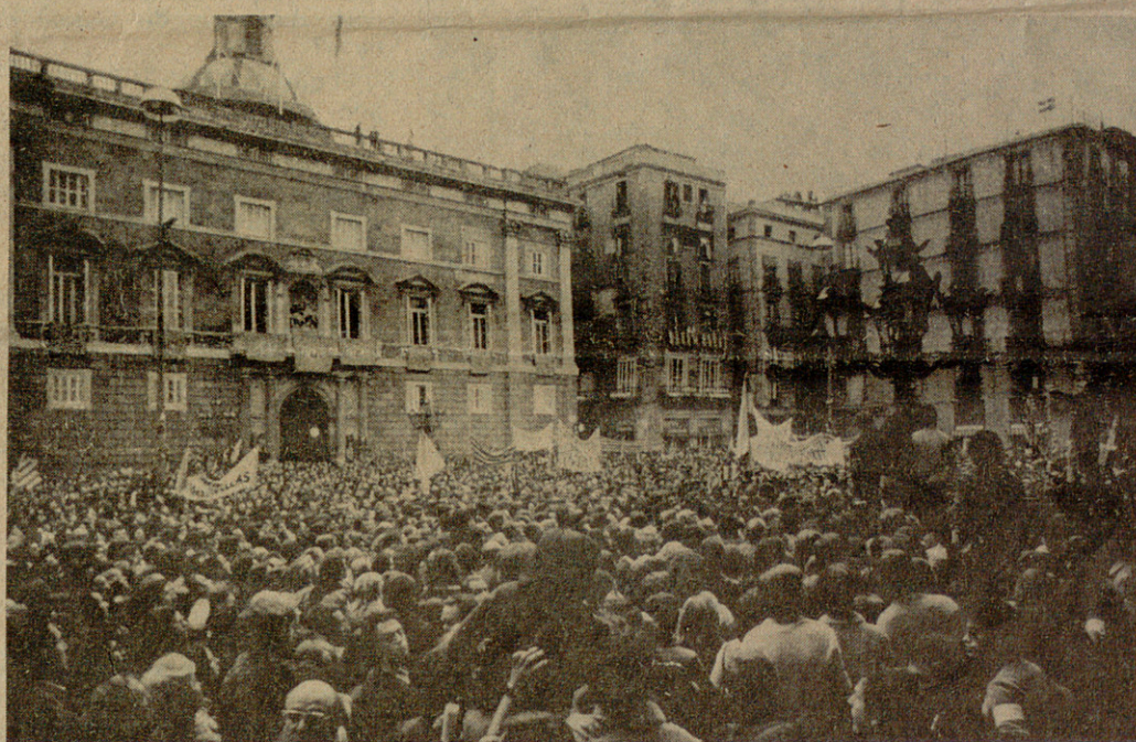
Diada de Sant Jordi. 23 d'abril de 1977. Volem l'Estatut.

Aquest full, portatveu d'Esquerra de Catalunya», surt al carrer quan el poble germà s'Euzkadi acaba de sofrir la mort d'alguns dels seus fills sota les bales de la Força Pública. El poble de Catalunya, com tots els altres de l'Estat, s'ha revoltat contra aquests fets i ha obtingut també la repressió sistemàtica com a resposta. A un mes de les eleccions, el Govern del president Suárez, màxim responsable de l'actuació de les Forces d'Ordre Públic, ha mostrat novament quina és la realitat que amaga sota la seva xerrameca «democràtica».