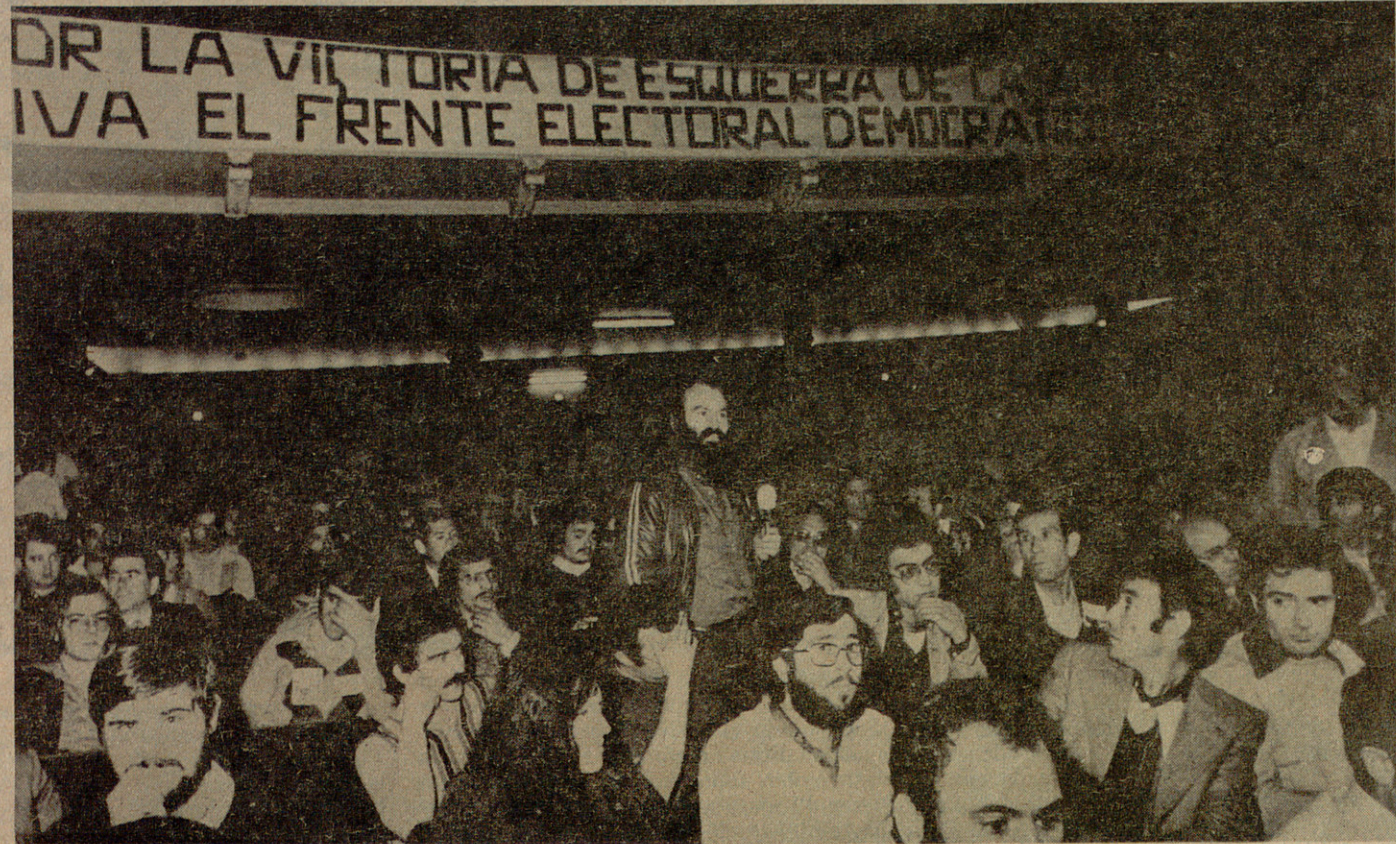
El Congrés de la Confederació Nacional dels Sindicats Unitaris de Treballadors reafirmà la seva adhesió a l'Esquerra de Catalunya.

En el torn de tarda, Pascual va que està sancionat per l'empresa, dirigí una carta als companys cridant-los al Front Electoral i anunciant la seva candidatura a les eleccions. «Jo us demano, companys, que us definiu sobre dues qüestions. La primera és la necessitat de la legalització de tots els partits i associacions populars sense cap mena d'excepcions. No poden haver-hi excepcions de llibertats mentre siguin legalitzats els partits, associacions i organismes democràtics. Precisament són els partits de la classe obrera més perjudicats per aquesta maniobra. No crec que el poble pugui decidir en la situació actual sobre qui és o no al, sobre quin partit ha de votar els treballadors i sobre