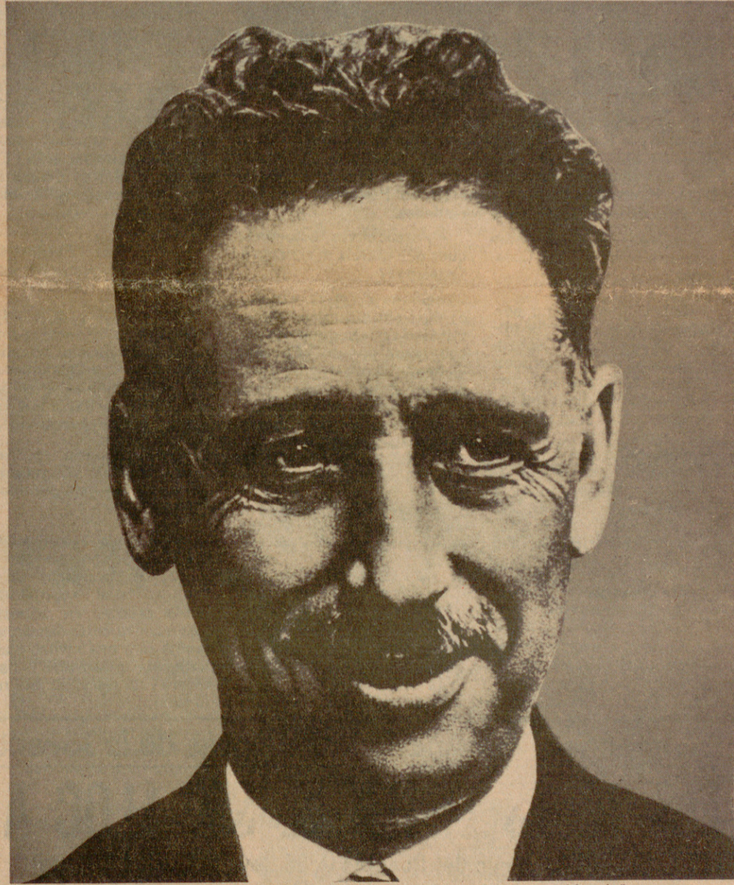
Lluís Companys, el President màrtir, afusellat pel feixisme a Montjuïc.