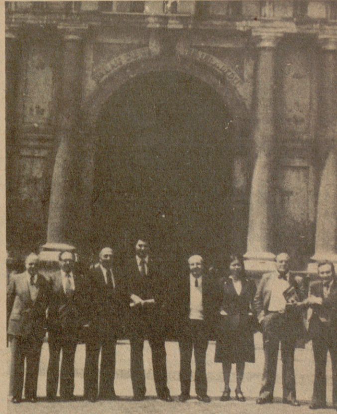
Els nostres primers candidats, davant el Palau de la Generalitat.

Per això quan els catalans reclamem la Generalitat, reclamem, a més del nostre dret de governar-nos, l'obra realitzada tant en matèria política com cultural, en l'aspecte jurídic com en el social, el restabliment de la Universitat Autònoma —model de convivència entre els seus diferents elements—, les nostres