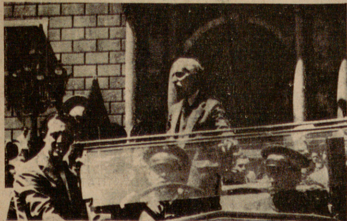
2 d'agost de 1931. Francesc Macià, el dia del plebiscit de l'Estatut de Núria.

El restabliment de la vigència dels principis i institucions de l'Estatut del 1932, amb totes les conseqüències que d'això lògicament se'n deriven, és a dir, la restauració de la Generalitat i el retorn al capdavant d'ella del President Tarradellas, és una de les reivindicacions bàsiques del programa electoral d'Esquerra de Catalunya. En aquest mes de juny