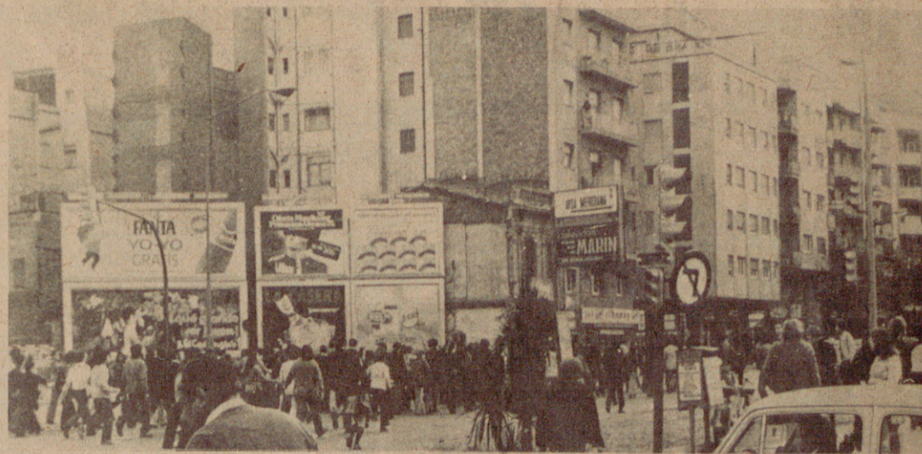
No és Catalunya qui provoca l'emigració, sinó el gran capital, que no respecta cap dret i al que solament mou el benefici. El gran capital ha apilat els treballadors en barris que són autèntics «ghetos» urbans.

Una cosa és que hi hagi moviments migratoris i per tant persones que es veuen obligades a abandonar la seva terra (emigrar) establint-se en un altre lloc (on emigren) i una altra cosa molt diferent és que es discrimini a una part dels ciutadans d'una nació atribuint-los permanentment la condició d'«immigrants», com si es tractés de ciutadans de segona categoria. És immigrant a Catalunya o a qualsevol part del món, la persona que arriba de fora i solament en el moment del desplaçament, però un cop establert aquí és resident temporal si vol instal·lar-se poc temps i tornar al lloc d'origen, o és ciutadà de ple dret si ell vol.