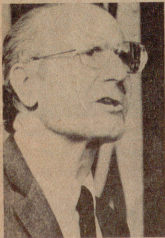
1. HERIBERT BARRERA COSTA