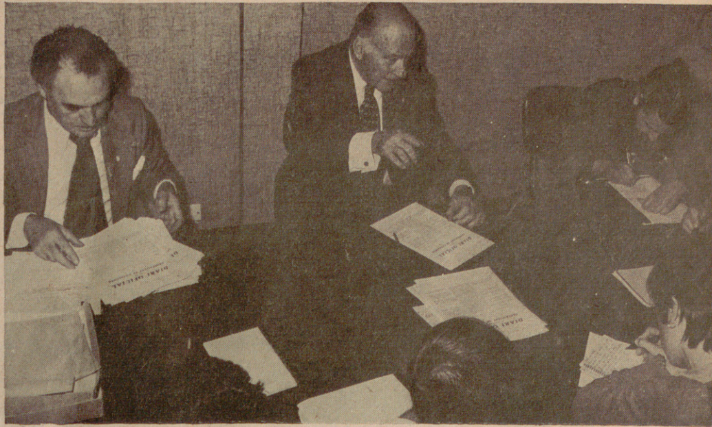
Una Assemblea de Parlamentaris que proclami vigents els principis i institucions de l'Estatut i faci tornar el President Tarradellas.

recolzant la investigació científica. Aquestes mesures seran aplicades a Catalunya per una Conselleria pròpia de la Generalitat. També, conscients del greu desequilibri econòmic existent avui entre les distintes nacionalitats i regions de l'Estat, Es-