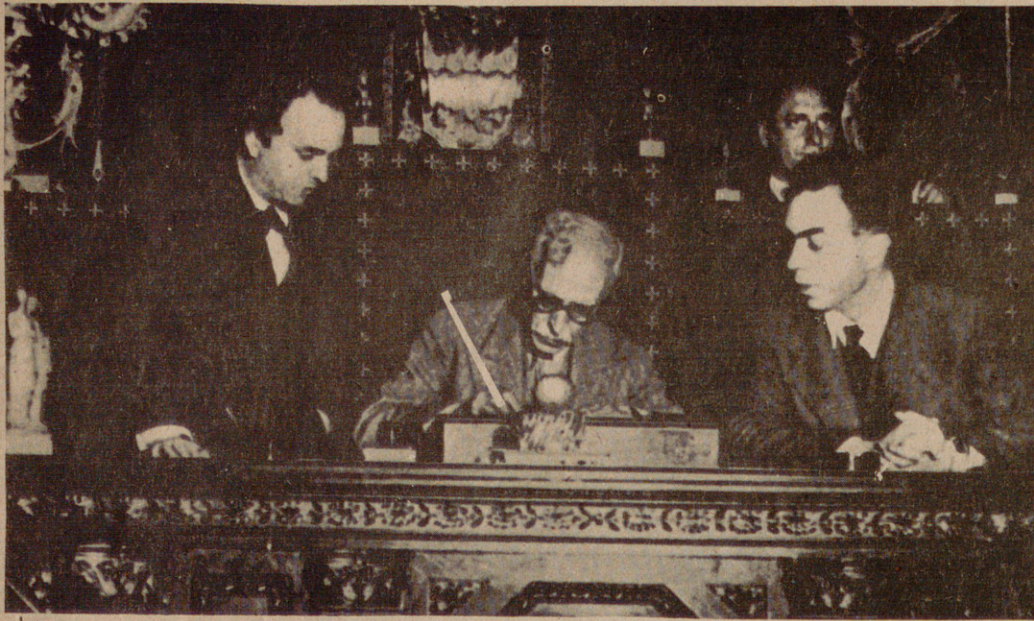
Volem recuperar el dret a regir-nos per nosaltres mateixos. 14 d'abril de 1931. Macià, president de la República Catalana.-