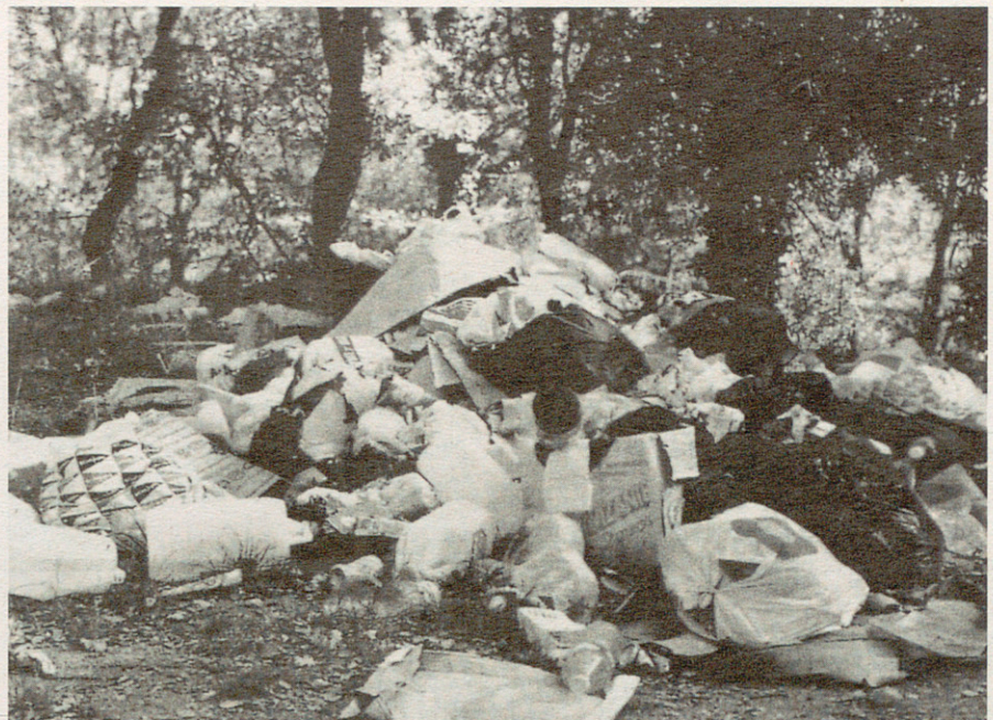
S'ha d'acabar del tot amb els abocadors il·legals

Cal dir que el PGRM no és d'obligat compliment. Hi ha obligació de complir amb la llei 6/93, però el programa és orientatiu. Les competències les tenen els municipis (art. 38.1). Les competències de l'EMSHTR estan establertes