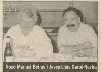
Xosé Manuel Beiras i Josep-Lluís Carod-Rovira

El 19 i 20 de novembre, el líder del Bloque Nacionalista Galego (BNG), Xosé Manuel Beiras, va visitar Barcelona convidat per ERC.