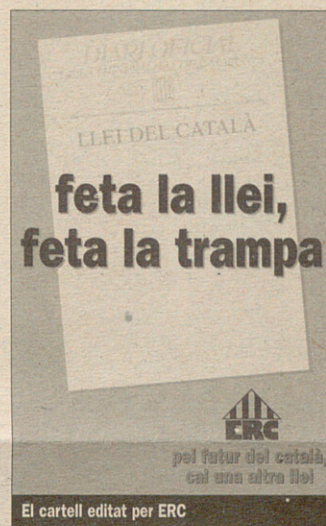
El cartell editat per ERC

ERC va treballar, tant dins de les reunions de la ponència com a les reunions bilaterals amb el govern de CiU i la resta de partits, per tal que la renovació legislativa treïés el català de la desigualtat jurídica amb el castellà i suposés un clar element de suport al seu