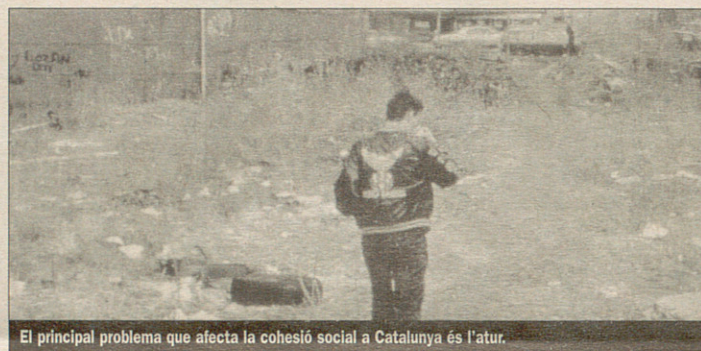
El principal problema que afecta la cohesió social a Catalunya és l'atur.

Dins del capítol de crítiques al govern Pujol, el document considera que el traspàs limitat de l'INEM