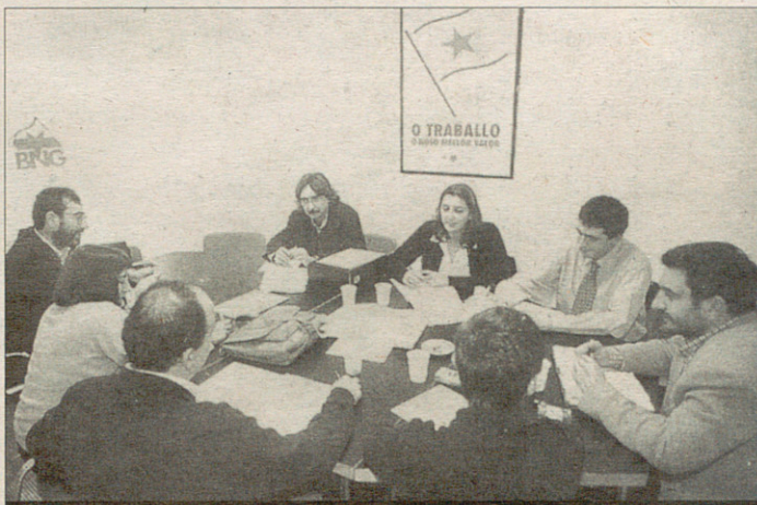
Un moment de la reunió celebrada a la seu del BNG de Vigo

Les relacions entre el BNG de Vigo i ERC de Terrassa neixen del contacte, internacional però fraternal, entre grups municipals que comparteixen realitats urbanes prou similars: grandàries poblacionals semblants, exagerats i →