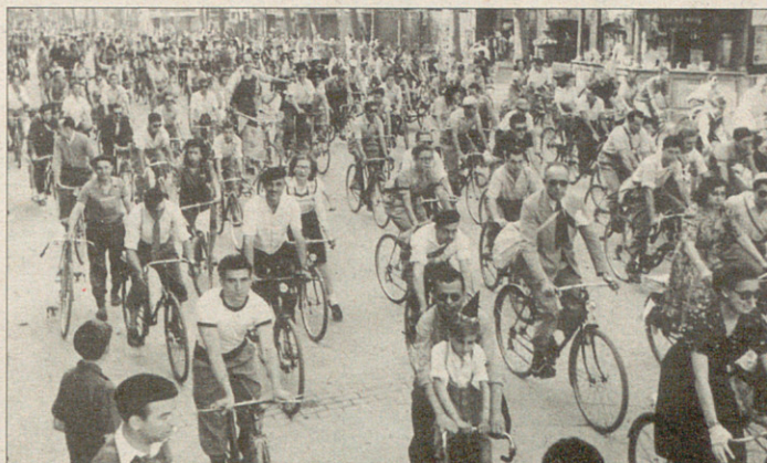
La bicicleta pot tornar a ser un mitjà de transport de primer ordre, sobretot a les grans ciutats.

amb el de la bicicleta; promocionar el turisme que busca relacionar-se amb el món rural i tradicional, amb major contacte amb la natura i que pot fer servir la bicicleta com a mitjà de transport més respectuós amb el medi; promoure l'edició de mapes d'itineraris adients per a les bicicletes i fomentar la seva integració en la xarxa europea; desenvolupar programes de formació ocupacional vinculats a la problemàtica ambiental i al món de la bicicleta; crear una comissió de suport, estudi i assessorament sobre la bicicleta, amb suficients mitjans per a ser efectiva; i impulsar la creació de serveis públics de bicicletes, especialment en llocs on