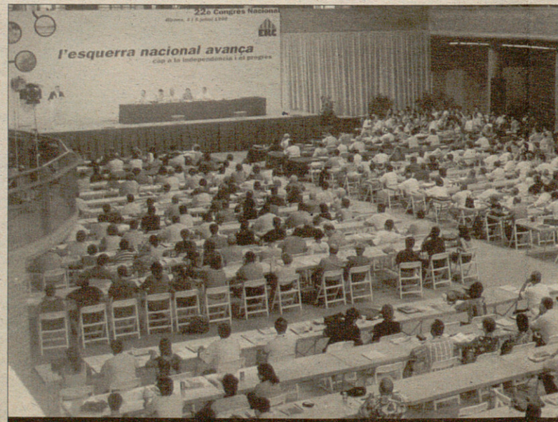
Al llarg del Congrés s'acreditaren 670 congressistes.