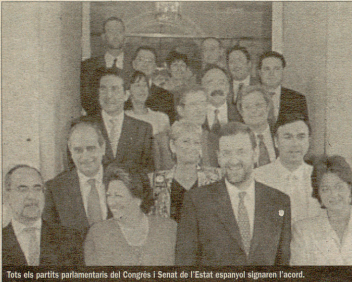
Tots els partits parlamentaris del Congrés i Senat de l'Estat espanyol signaren l'acord.

Les tretze formacions polítiques estatals, nacionals i regionals representades a les cambres legislatives espanyoles signaren, el passat dia 7 a Madrid, l'anomenat Codi de conducta política en relació amb el transfuguisme a les corporacions locals , que suposa un compromís ètic del conjunt de forces polítiques a no beneficiar-se dels vots dels trànsfuges als ajuntaments, i negar-los molts dels beneficis econòmics i institucionals de què fins ara han gaudit. Per part d'ERC hi assistiren el secretari general, Josep-Lluís Carod-