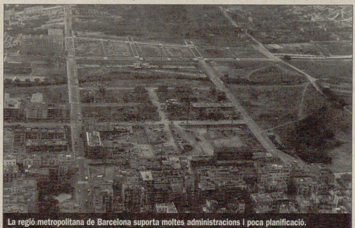
La regió metropolitana de Barcelona suporta moltes administracions i poca planificació.

Metropolità, que la Generalitat es va comprometre a elaborar fa gairebé 10 anys per tal de donar resposta a aquesta greu problemàtica, continua sense aparèixer tot i