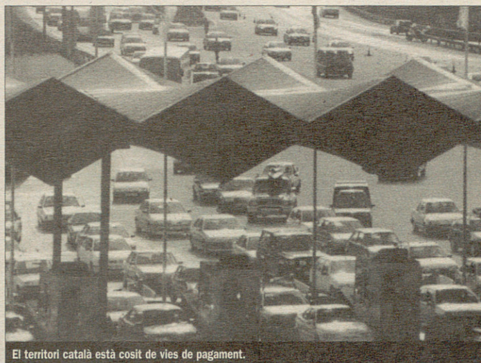
El territori català està cosit de vies de pagament.