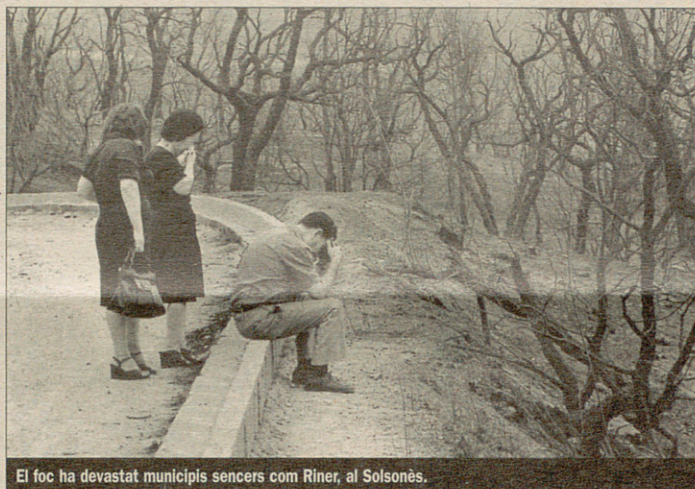
El foc ha devastat municipis sencers com Riner, al Solsonès.

Els primers moviments per tal de materialitzar un debat parlamentari —en plenes vacances de la cambra autonòmica— van ser protagonitzats per ERC i IC, als quals se sumà posteriorment el PSC. CiU, sense el suport en aquest cas del PP, no pogué aturar-lo. Les declaracions prèvies al Ple dels dies 4 i 5, d'agost dels membres del govern respongueren sense sorpreses a la doble estratègia mediàtica que CiU aplica quan hi ha problemes: prepotència