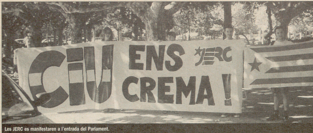
Les JERC es manifestaren a l'entrada del Parlament.