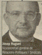
Josep Huguet Vicesecretari general de Relacions Polítiques i Sindicals