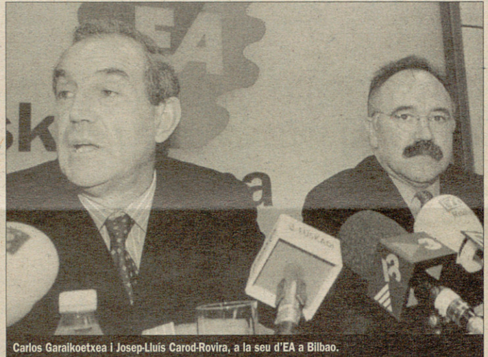
Carlos Garaikoetxea i Josep-Lluís Carod-Rovira, a la seu d'EA a Bilbao.

Si just abans de l'Onze de Setembre ERC presentava al Parlament la proposta que Catalunya s'apuntés a la via dels «drets his-