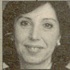
Angels Côté Secretària de Relacions Sindicals