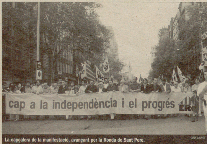
La capçalera de la manifestació, avançant per la Ronda de Sant Pere.

A més del dinar celebrat al passeig de Lluís Companys de Barcelona, que aplegà 400 militants i simpatitzants, ERC convocà a la manifestació de la tarda més de 5.000 persones.