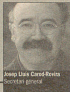
Josep Lluís Carod-Rovira Secretari general