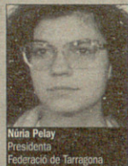
Núria Pelay Presidenta Federació de Tarragona