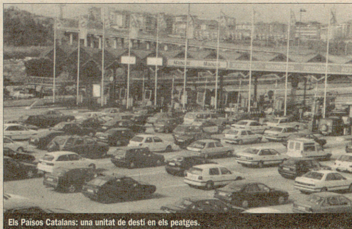
Els Països Catalans: una unitat de destí en els peatges.

Una setmana més tard, el diputat Josep Huguet presentava a la cambra catalana una proposició no de llei per a l'elaboració d'un pla de rescat dels peatges de les autopistes, amb tres fases: « rescat prioritari dels peatges de les vies que actuen com a rondes ur-