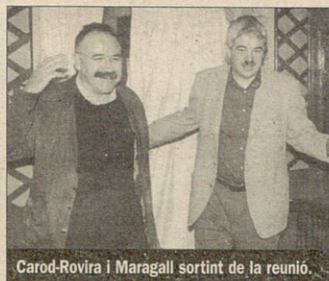
Carod-Rovira i Maragall sortint de la reunió.

A mitjan mes d'octubre, i després d'un debat de política general on el portaveu d'ERC estenia l'acta de defunció del pujolisme com a proposta de futur, Carod-Rovira