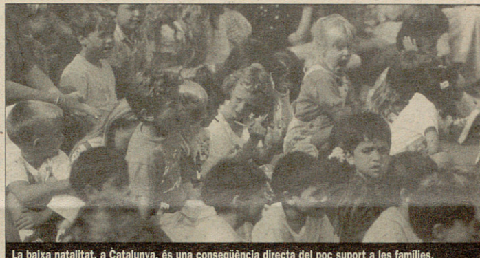
La baixa natalitat, a Catalunya, és una conseqüència directa del poc suport a les famílies.

D'entre aquestes propostes cal destacar les que reclamen fiscalment la multiplicació per quatre de les actuals dotacions per des-