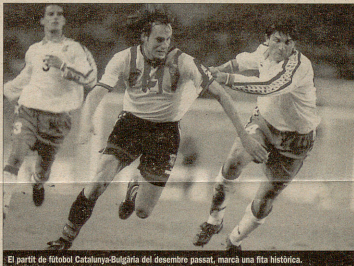
El partit de futbol Catalunya-Bulgària del desembre passat, marcà una fita històrica.

CiU, enmig d'aquesta represa en la reivindicació de les selec-