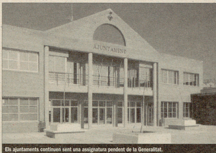
Els ajuntaments continuen sent una assignatura pendent de la Generalitat.

Amb els pressupostos de CiU, doncs, és perpetua la subsidiarietat progressiva del món local, al qual es continua fent dependre de les subvencions i transferències condicionades per garantir l'execució dels projectes d'infraestructures i la continuïtat dels serveis bàsics. En vista de l'experiència dels darrers anys, a més, ningú no es