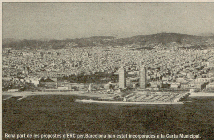
Bona part de les propostes d'ERC per Barcelona han estat incorporades a la Carta Municipal.

ERC també ha inclòs en el redactat final aspectes referents a l'ús social de la llengua catalana, la democratització i la participació