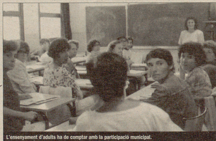
L'ensenyament d'adults ha de comptar amb la participació municipal.

En vista de la situació, la Comissió d'Ensenyament de la Federació de Municipis de Catalunya