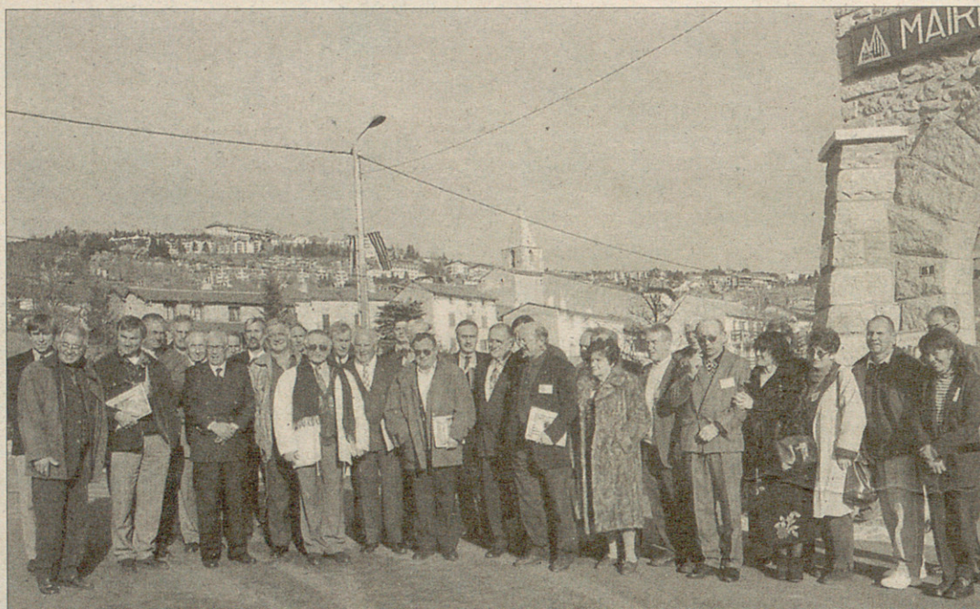
Els alcaldes cerdans, reunits a Font-romeu, van evidenciar la voluntat de cooperar per damunt de fronteres artificials.

El Manifest, donat a conèixer l'11 de desembre passat amb motiu de la celebració de la Diada de la Cerdanya, reclama el reconeixement específic de la comarca com una unitat històrica, cultural i socioeconòmica i la creació d'un ens gestor que «superant les velles inèrcies burocràtiques treba-