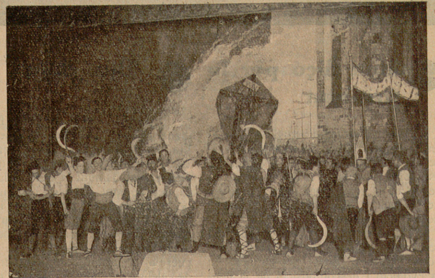
Una escena de la revolta del 1640