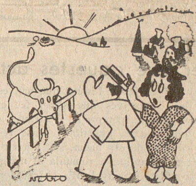
— No està mal aquesta posta de sol!... — Sobretot per un país petit!...

Totes les dictadures, en actuar contra les majories, cauen en el despotisme.