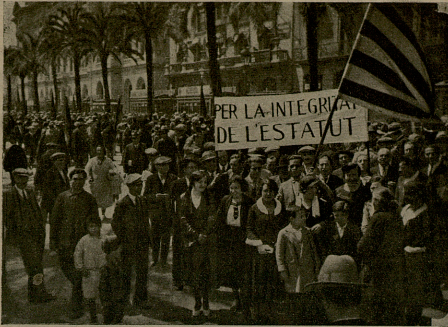
la bandera de l'ateneu nacionalista republicà de la bonanova i la pancarta del nostre casal, a la manifestació pro-integritat de l'estatut