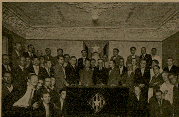
La Presidència de l'acte

El dimarts, 20 de setembre, tingué lloc l'acte inaugural del nostre nou estatge. Tot i el temps transcorregut, no volem deixar de ressenyar aquell acte magne que quedarà per sempre més com una fita memorable en la marxa ascendent del "Casal" i que ha deixat, a Gràcia, un sediment de records i d'entusiasmes que s'ha traduït, més tard, en l'augment de militants d'Esquerra que ha portat l'èxit esclatant del 20 de novembre al Districte VIII,è, com a la resta de Barcelona i de Catalunya.