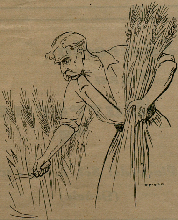
Collita de llibertats

D'ençà de la darrera sortida del nostre BUTLLETÍ s'han produït dos fets principals que ens cal assenyalar i comentar des d'aquest lloc frontal del nostre portantveu. L'un —transcendental per a la nostra Pàtria—, ha estat