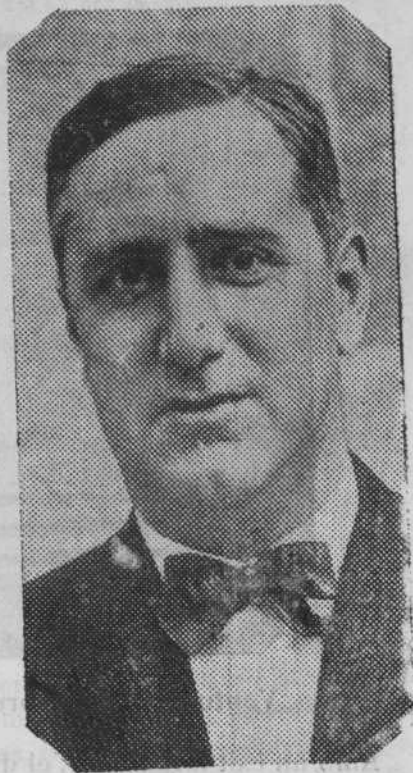
En Carles Pi i Sunyer Notu Ministre del Treball del Govern de la República

Avui mateix ens enterem com en el primer Consell de Govern celebrat, s'ha donat pressa al traspàs de serveis, i tenim dret i confiança a esperar-ne benifets per la nostra terra i per la República.